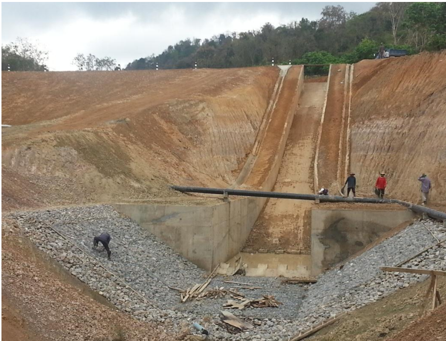
อาคารระบายน้ำล้นและท่อส่งน้ำ