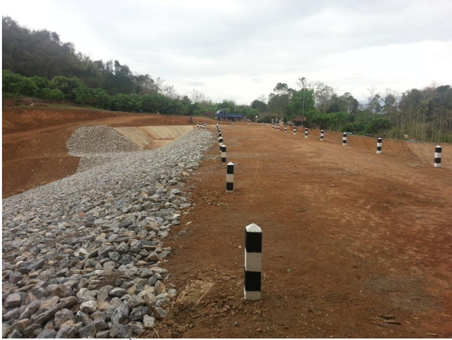
ดำเนินการก่อสร้างอ่างเก็บน้ำ ขนาดทำนบดิน กว้าง 8 เมตร ยาว 53 เมตร สูง 16 เมตร ขนาดความจุ 86,000 ลูกบาศก์เมตร