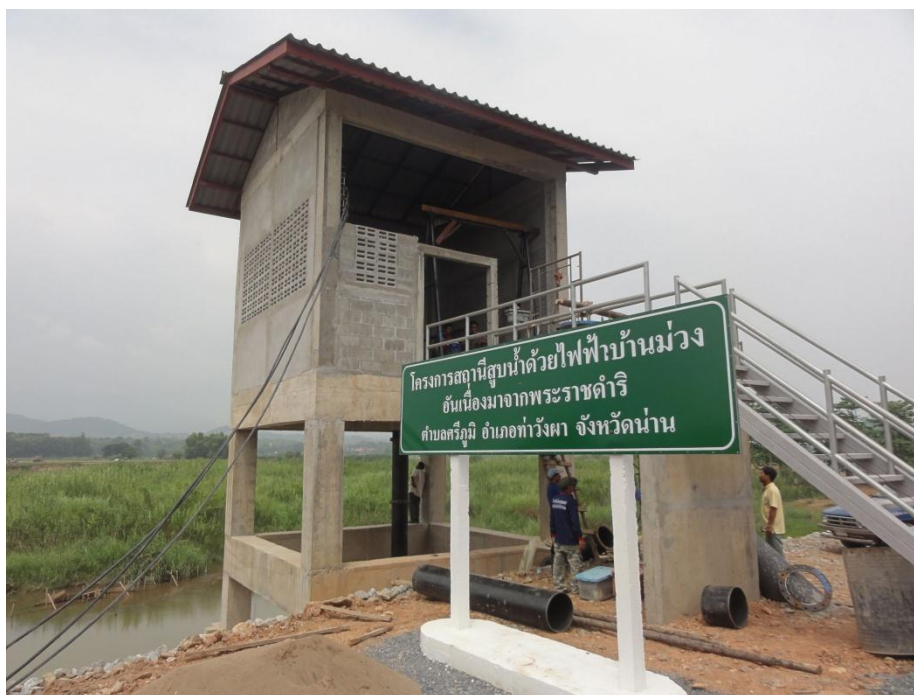
จัดตั้งสถานีสูบน้ำ