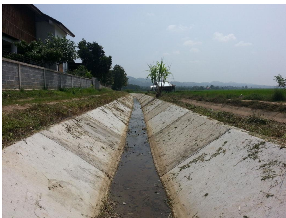
ปรับปรุงคลองส่งน้ำคลองตาดคอนกรีต