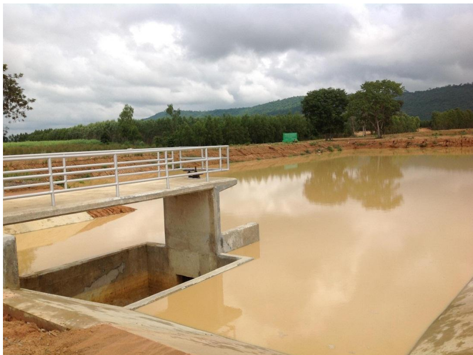
สระเก็บน้ำและอาคารบังคับน้ำ แห่งที่ ๒