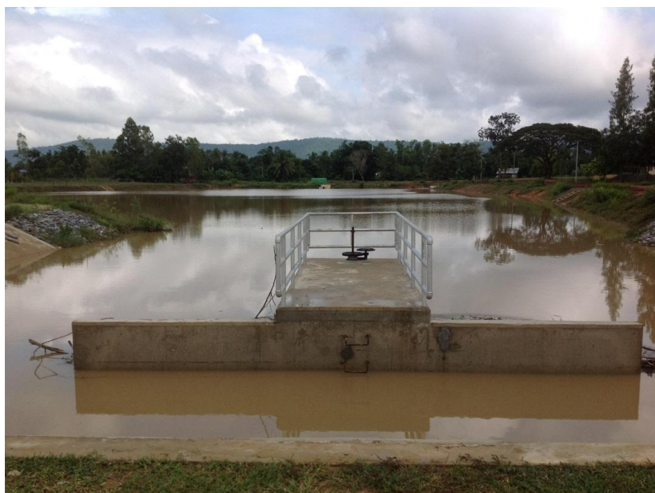
สระเก็บน้ำและอาคารบังคับน้ำ แห่งที่ ๓