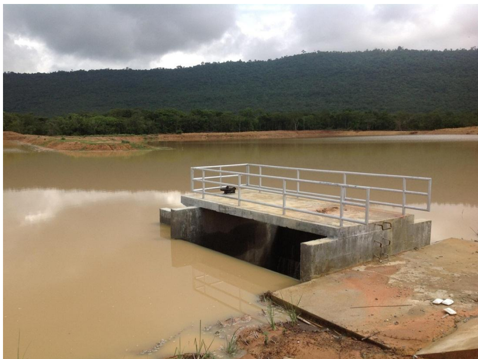
สระเก็บน้ำและอาคารบังคับน้ำ แห่งที่ ๑

กรมชลประทาน ดำเนินการจัดหาแหล่งน้ำให้ราษฎร หมู่ ๘ บ้านคลองทราย โดยก่อสร้างอาคารบังคับน้ำ จำนวน ๓ แห่ง อาคารระบายน้ำล้น จำนวน ๑ แห่ง และอาคารปลายคลองผันน้ำ ๑ แห่ง พร้อมชุดลอกอ่างเก็บน้ำ สระเก็บน้ำขนาดความจุ ๔๓๔,๕๙๐ ลูกบาศก์เมตร พร้อมจัดทำทางผันน้ำระยะทาง ๒,๒๙๒ เมตร และท่อลอดถนน แล้วเสร็จเดือน เมษายน ๒๕๕๕