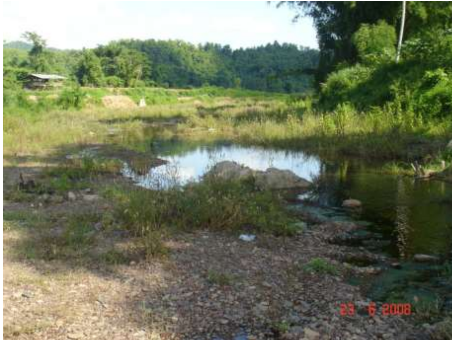
สภาพพื้นที่ก่อนดำเนินการก่อสร้าง