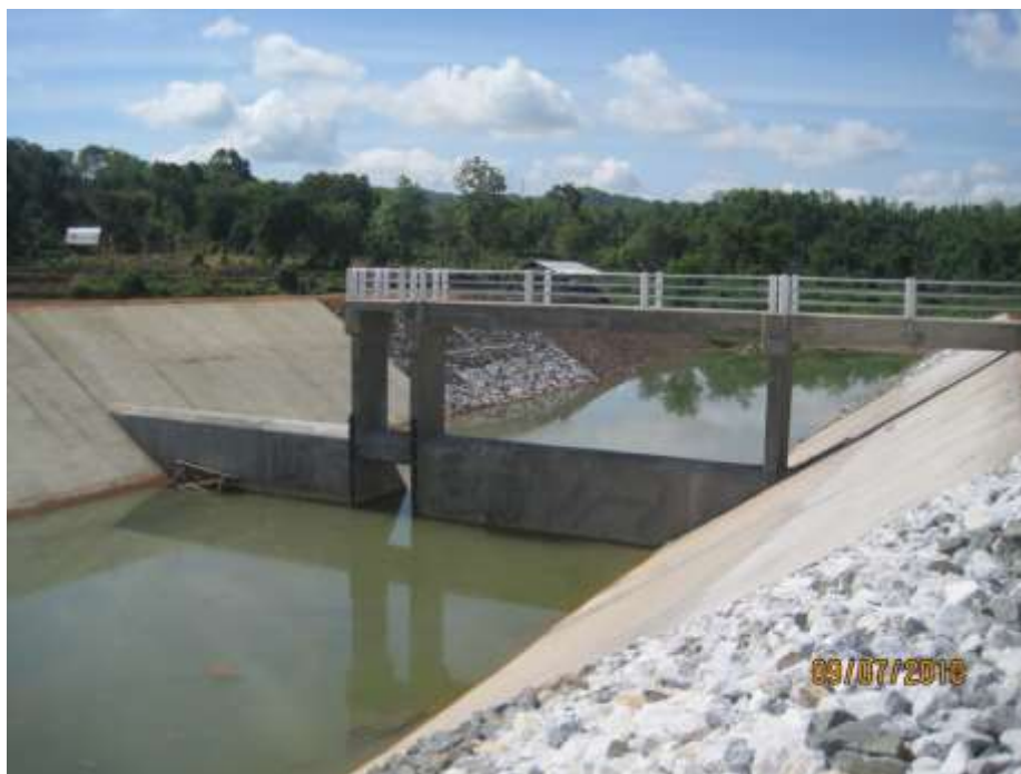
ดำเนินการก่อสร้างแล้วเสร็จ