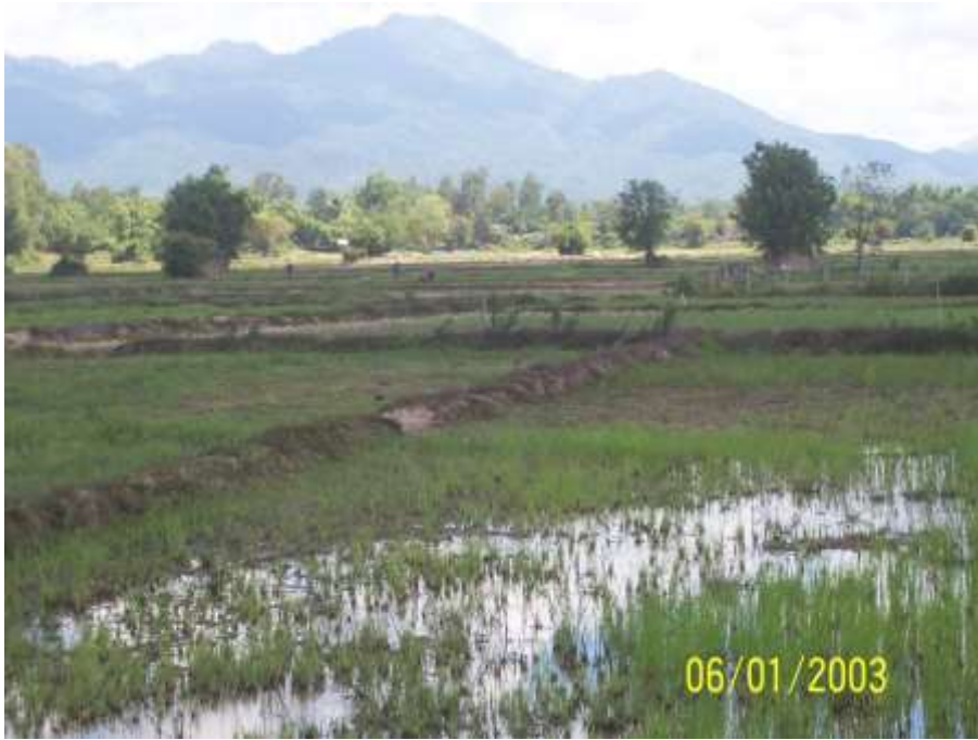
สภาพพื้นที่การเกษตร